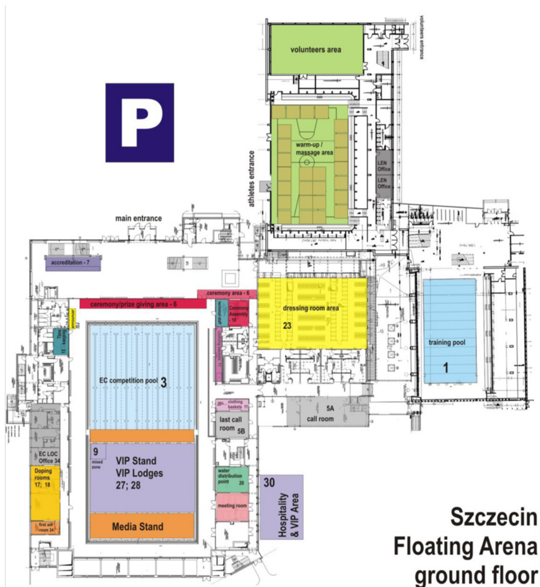
Szczecin Floating Arena ground floor