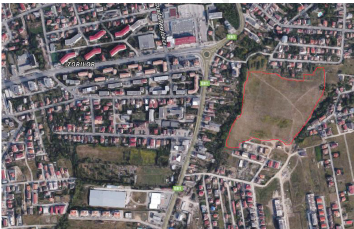
Rysunek 1. Obszar przeznaczony na inwestycję