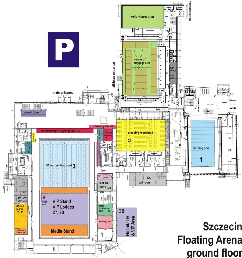
Szczecin Floating Arena ground floor